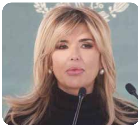
Claudia Pavlovich Arellano