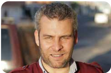
Alfredo Ramírez Bedolla